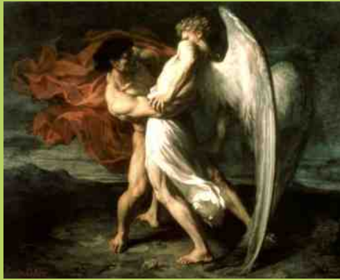
La lutte de Jacob avec l'ange

Une fois par mois, les jeudis à 17 h 00 "Le cycle de Jacob-Israël, le patriarche" Genèse 25, 19 à 50, 14