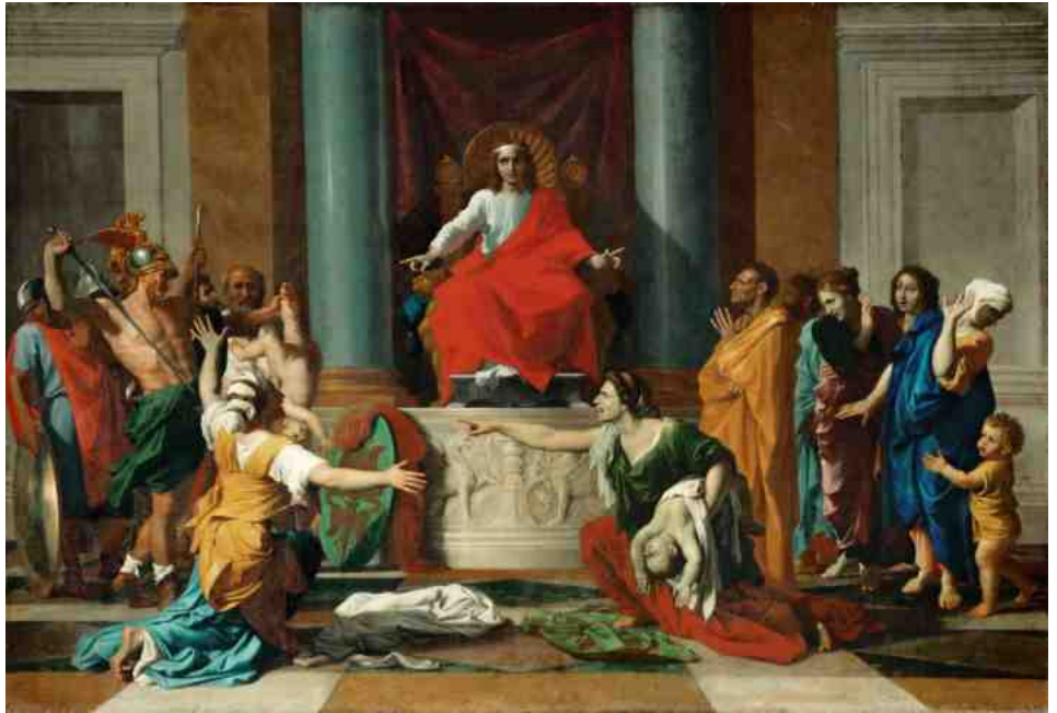
LE JUGEMENT DE SALOMON - NICOLAS POUSSIN (1649)