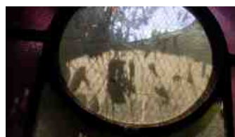
vitrail intérieur chœur