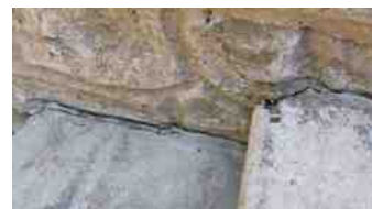
Marche du temple