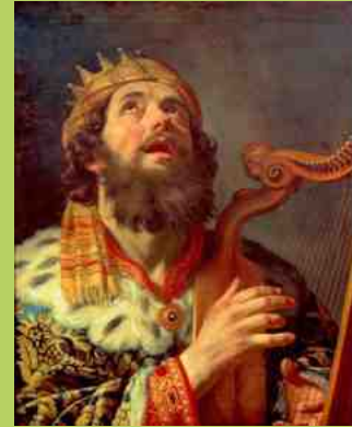
Le roi David

Une fois par mois, les mardis à 14 h 30 "Difficile royauté : Saül, David, Salomon"