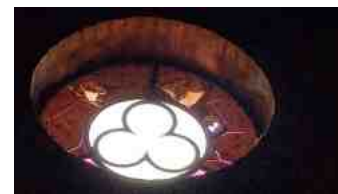
Vitrail au-dessus de l'entrée