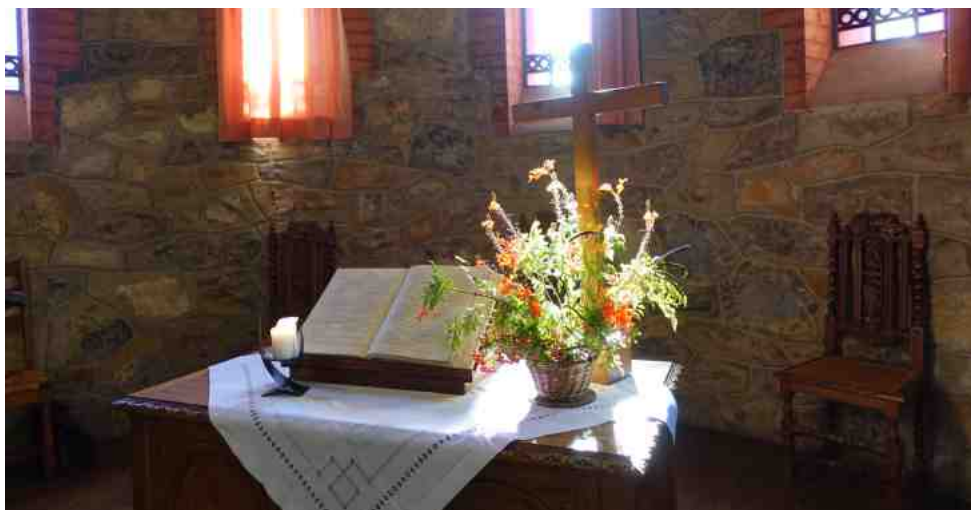
Table de communion au temple

Entretien intérieur temple - Cécile MICHEL - 06 21 40 03 52