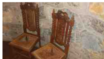
Chaises du chœur